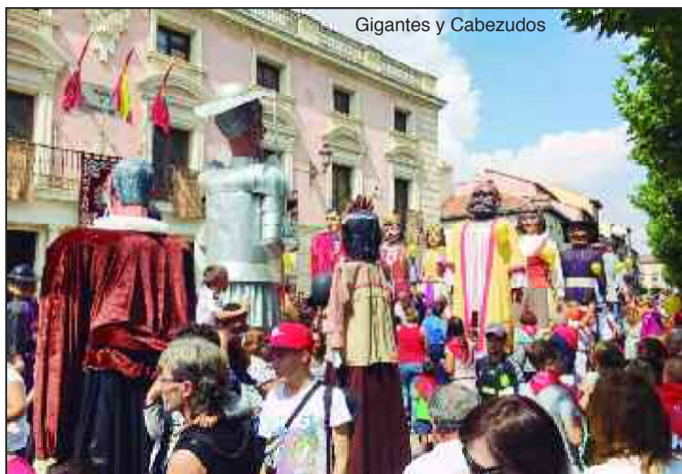
Gigantes y Cabezudos