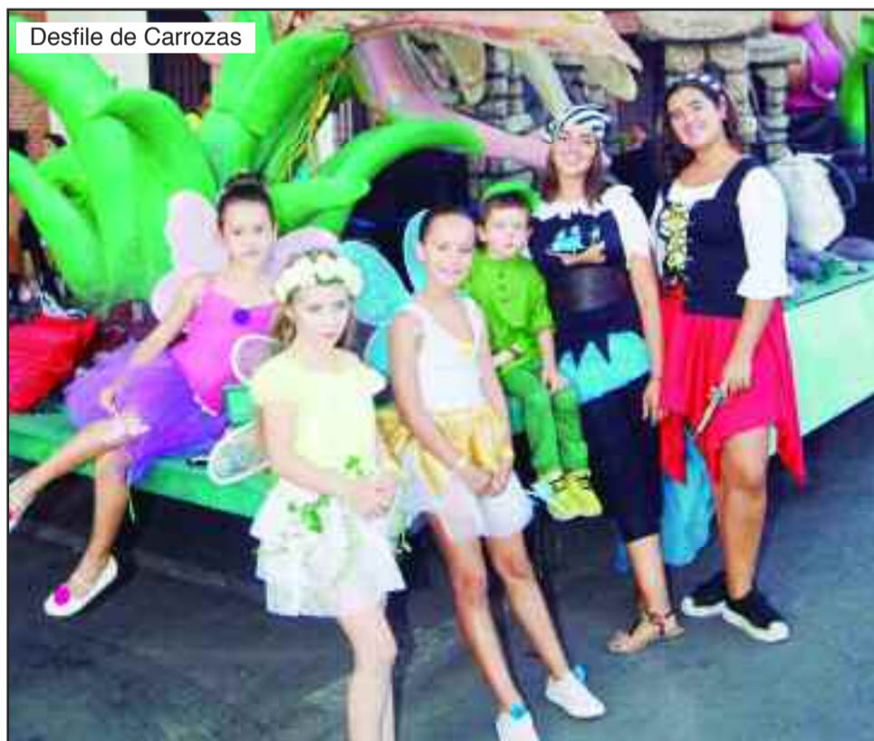
Desfile de Carrozas

ciones como la de la Comparsa de Gigantes y Cabezudos y "Los Doblones 1994-2018, nuestra historia", en la Casa de la Entrevista, o "Checoslovaquia (1968-1991)", "Sensaciones", "Ilustrar al mirar" en Santa María la Rica, y "Alcalá de Henares, 20 años Patrimonio de la Humanidad" en la Capilla del Oidor.