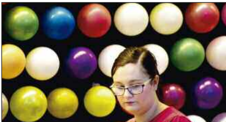
FOTOGRAFIA GANADORA DEL AÑO PASADO de Javier Viñals de Arcos

Por tercer año consecutivo, y en colaboración con el Club de la Fotografía, las Ferias de Alcalá de Henares contarán con el concurso de fotografía "La ciudad en fiestas", dirigido a personas mayores de edad, y que pretende contribuir a documentar gráficamente las Ferias de la ciudad. Se han establecido tres premios: El primer premio, de 200€ en material fotográfico y una beca de estudios