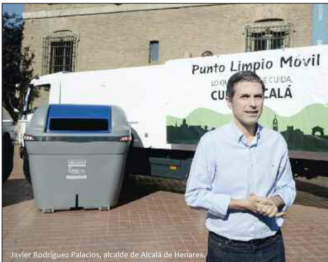
Javier Rodríguez Palacios, alcalde de Alcalá de Henares.

El alcalde de Alcalá de Henares, Javier Rodríguez Palacios, manifestó su rechazo a la propuesta del Gobierno regional de recrecer el quinto vaso del vertedero hasta que entren en funcionamiento las instalaciones de la planta de tratamiento de residuos en Loeches.