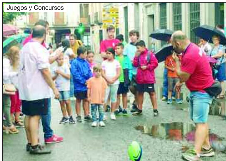
Juegos y Concursos